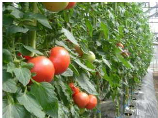
トマトの施設栽培