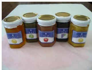
実習で製造した各種ジャム