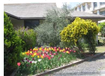
園芸装飾 創作花壇